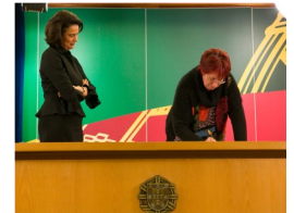
Assinatura das Cartas de Compromisso referentes aos apoios, com a presença da Secretária de Estado Teresa Morais

Estas medidas são assim uma tentativa de resposta da Secretaria de Estado dos Assuntos Parlamentares e Igualdade às dificuldades sentidas no terreno pelas instituições, serviços, técnicos e pelas próprias vítimas.