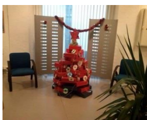
Árvore de Natal do Espaço Internet